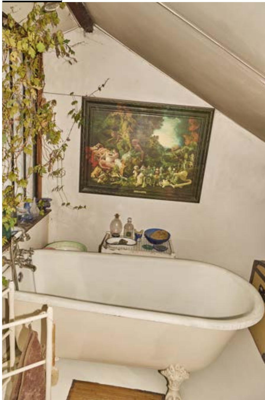
← Vue de la salle de bain de la Maison Brissot, sur le mur est accroché Le Repos de Diane , d'après Pierre Paul Rubens